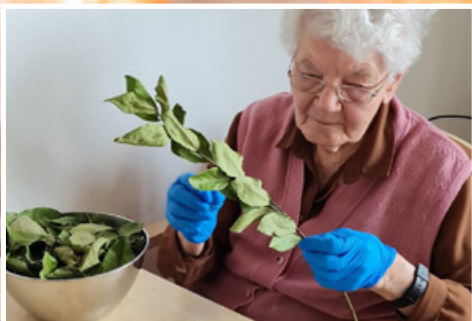
LORBEERBLÄTTER AUS UNSEREM GARTEN Die erste eigene Ernte